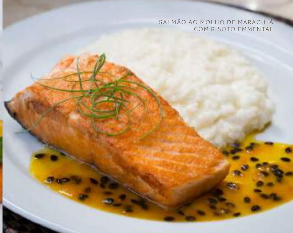
SALMÃO AO MOLHO DE MARACUJÁ COM RISOTO EMMENTAL