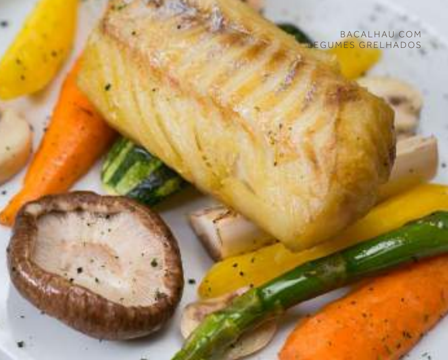
BACALHAU COM LEGUMES GRELHADOS