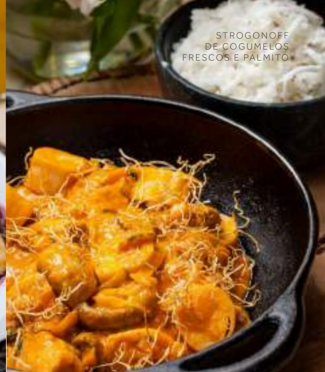
STROGONOFF DE COGUMELOS FRESCOS E PALMITO