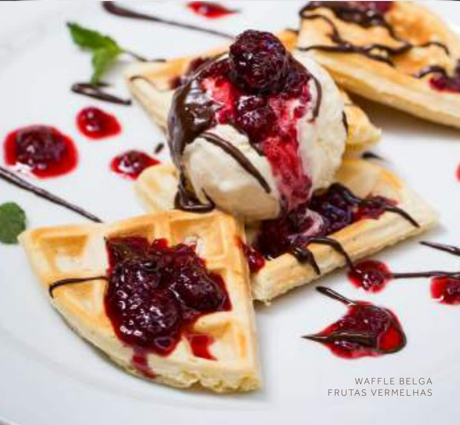
WAFFLE BELGA FRUTAS VERMELHAS