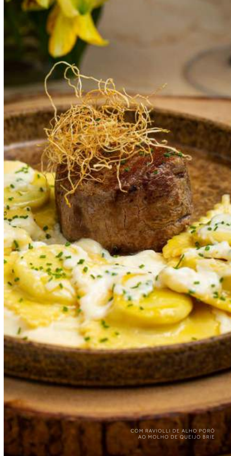
COM RAVIOLLI DE ALHO PORÓ AO MOLHO DE QUEIJO BRIE