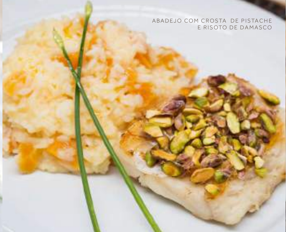
ABADEJO COM Crosta DE PISTACHE E RISOTO DE DAMASCO