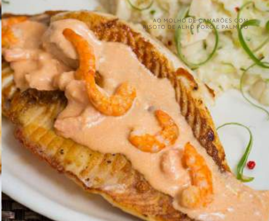
AO MOLHO DE CAMARÕES COM RISOTO DE ALHO PORÓ E PALMITO