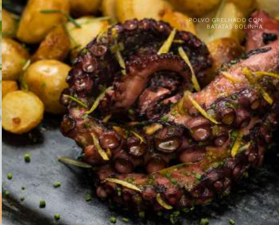
POLVO GRELHADO COM BATATAS BOLINHA