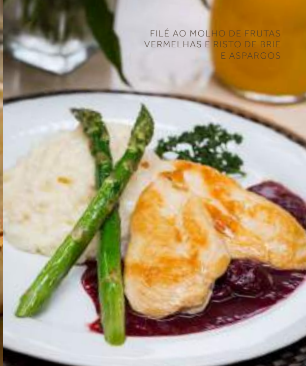
FILÉ AO MOLHO DE FRUTAS VERMELHAS E RISOTO DE BRIE E ASPARGOS