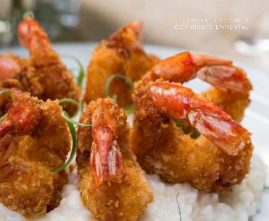
CAMARÃO CROCANTE COM RISOTO EMMENTAL