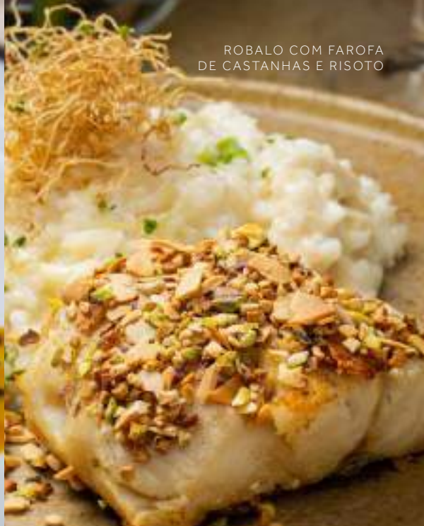
ROBALO COM FAROFA DE CASTANHAS E RISOTO